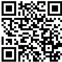
Official Facebook Event

Official Email: icomos.ahmt.2016@gmail.com